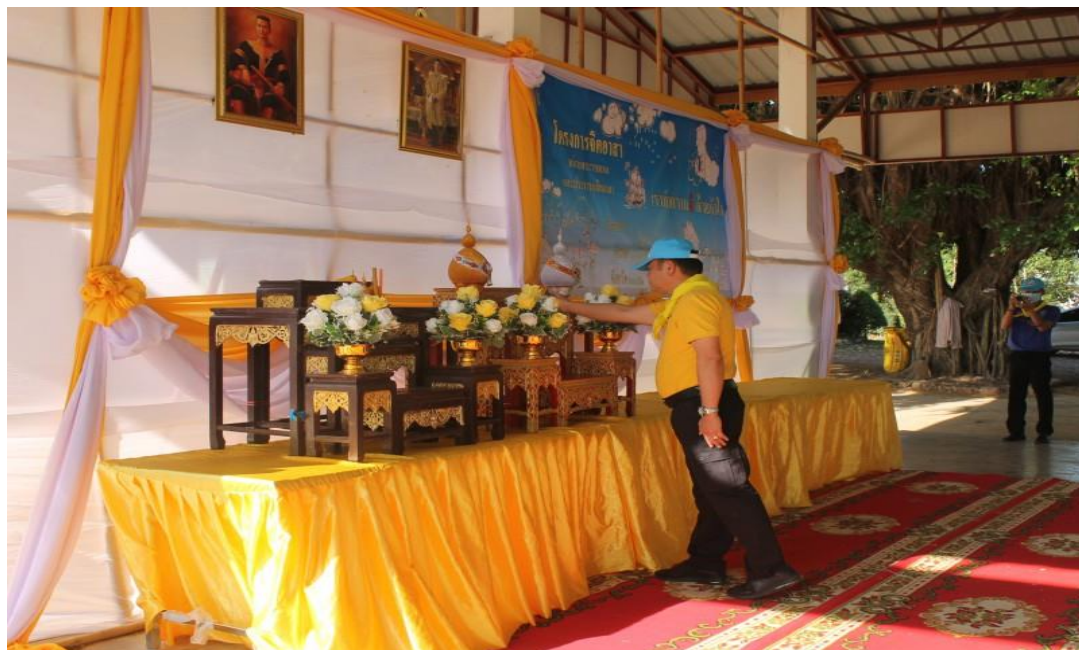
นายอำเภอเมยวดี คณะผู้บริหาร ข้าราชการพนักงานเทศบาล กำนัน ผู้ใหญ่บ้าน ประชาชนจิตอาสาทำความดีด้วยหัวใจในวันสำคัญของชาติประจำปี พ.ศ.๒๕๖๖